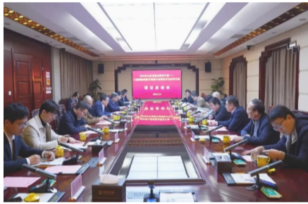
大型钢结构数字建造与运维技术及应用示范”项目启动会在经典集团召开

下一步，项目组将严格按照2024年山东省重点研发计划（重大科技创新工程）项目绩效评价的要求，抓好项目课题的研究与实施，力争早日实现产业化。