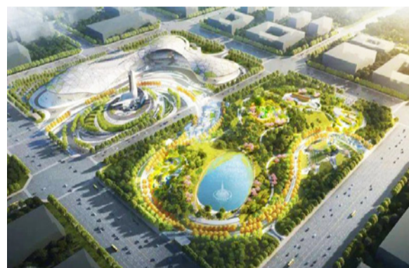
河北园林博览会主展馆项目