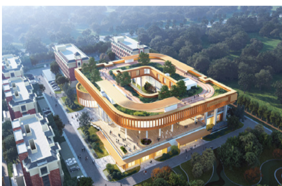
康养服务中心建设项目