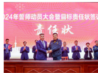
制造部负责人签订了年度目标责任状

集团营销中心负责人、项目管理中心负责人、项目经理代表、制造一部负责人、制造二部负责人、中冶制造部负责人进行表态发言。