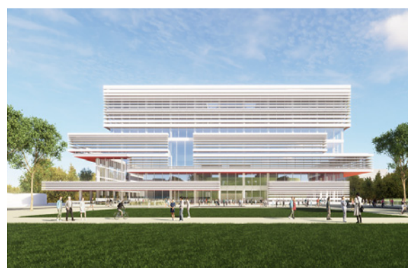
装配式学校二十余项建筑项目