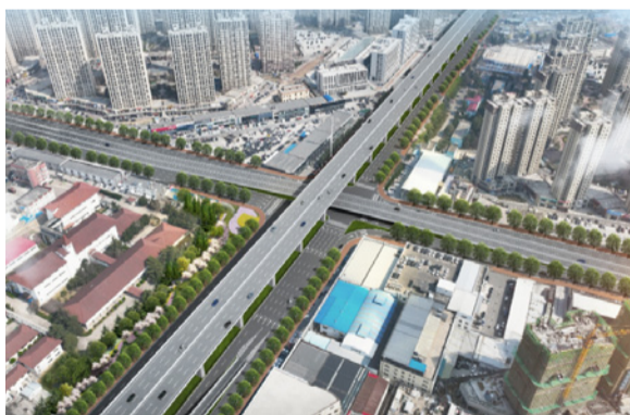
青岛跨海大桥、济曲快速路等桥梁类项目工程