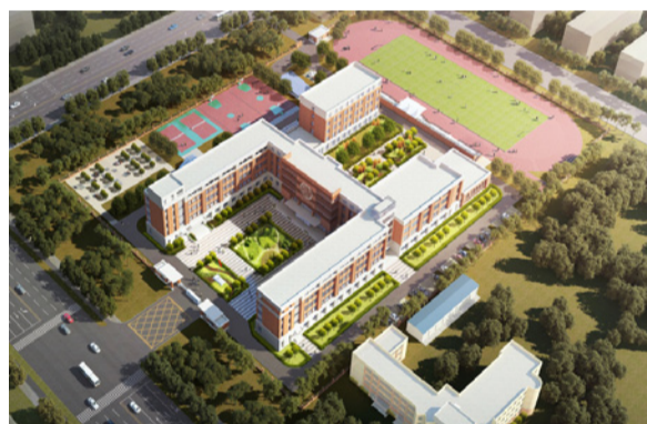
装配式学校二十余项建筑项目