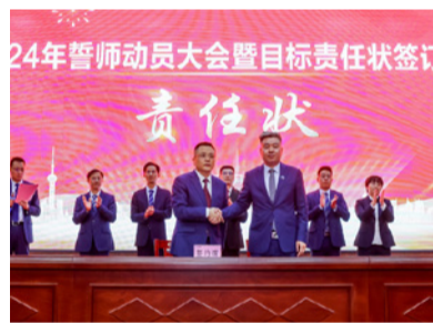
生产负责人签订了年度目标责任状