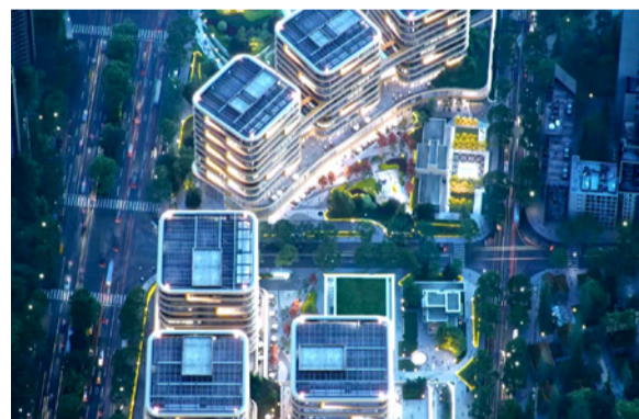
上海科创源项目打造“人文+科技”“科创生态圈”