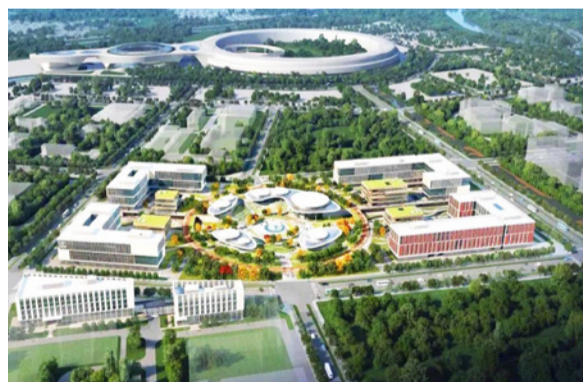
怀柔科学城综合性国家科学中心项目